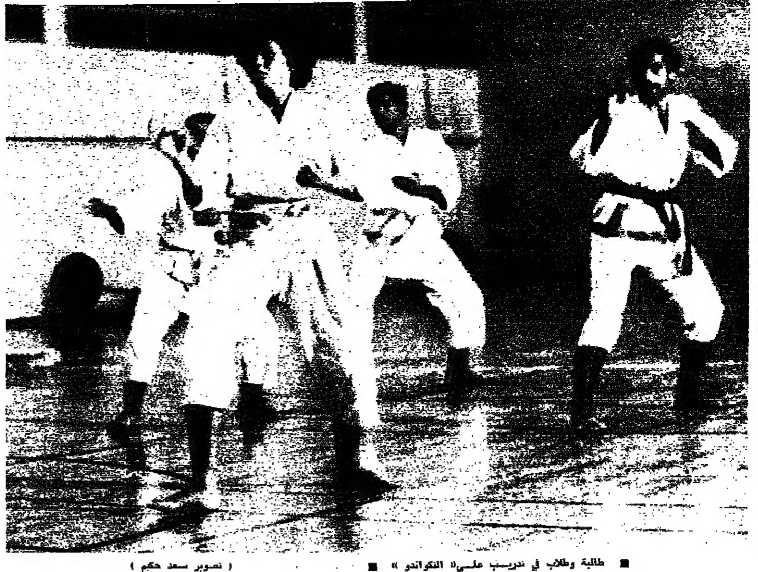
طالبة وطلاب في تدريب على «التكواندو» ■ (تصوير سعد حكيم)